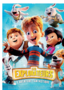
LES EXPLORATEURS : L'AVENTURE FANTASTIQUE