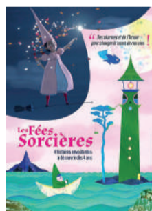
LES FÉES SORCIÈRES