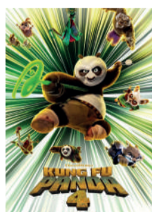
KUNG FU PANDA 4