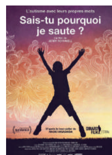
SAIS-TU POURQUOI JE SAUTE ?