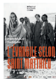
L'ÉVANGILE SELON SAINT MATTHIEU

POUR LE CONFORT ET LA TRANQUILLITÉ DE TOUS, L'ENTRÉE DANS LA SALLE NE SERA PLUS AUTORISÉE 10 MINUTES APRÈS LE DÉBUT DE LA SÉANCE.