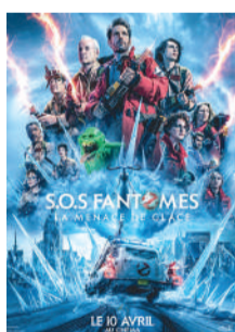
SOS FANTÔMES : LA MENACE DE GLACE