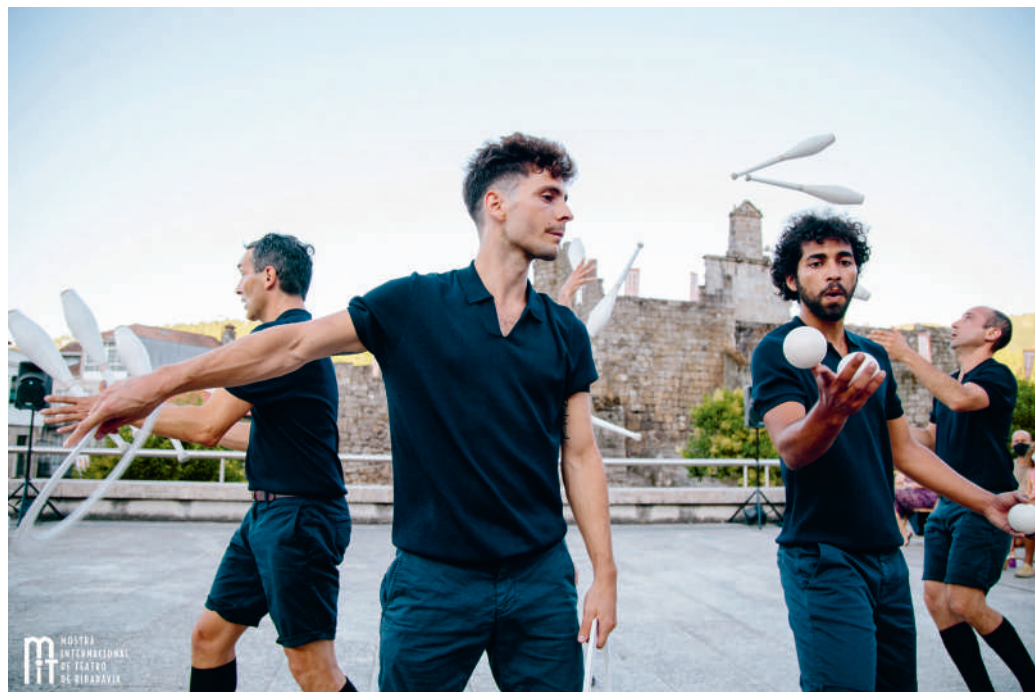
COPYLEFT, DE LA COMPAGNIE NICANOR DE ELIA.

La promesse de Jeux olympiques populaires a suscité des idées. Les trublions de la compagnie multidisciplinaire Nicanor de Elia ont relevé le défi en imaginant Copyleft , un spectacle où cinq artistes en scène mêlent improvisation, jonglerie et danse contemporaine. La troupe venue de Belgique a d'ailleurs reçu pour cette création le label « Olympiade culturelle » pour ses clins d'œil appuyés au monde du sport. Copyleft est proposé pour tous et toutes lors d'une représentation gratuite sur l'esplanade de l'hôtel de ville de Bondy, samedi 20 avril à 16h30. De quoi se préparer en douceur pour les JO qui nous attendent le 26 juillet prochain. ● MÉLINE ESCRIBUELA