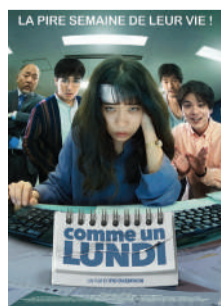
COMME UN LUNDI