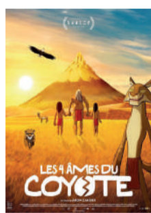
LES 4 ÂMES DU COYOTE