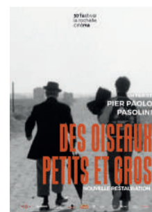
DES OISEAUX PETITS ET GROS

POUR LE CONFORT ET LA TRANQUILLITÉ DE TOUS, L'ENTRÉE DANS LA SALLE NE SERA PLUS AUTORISÉE 10 MINUTES APRÈS LE DÉBUT DE LA SÉANCE.