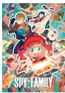
SPY FAMILY CODE : WHITE